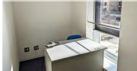
プレ創業支援ルーム C

【面積】約5㎡(3室/机・椅子付) 【使用料】4,920円/1ヶ月※ 【入居期間】最長6ヶ月間/更新1回まで