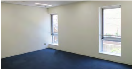
メイン創業支援ルーム A

【面積】約28㎡(6室) 【使用料】25,980円/1ヶ月※ 【入居期間】1年(2回の更新可能)