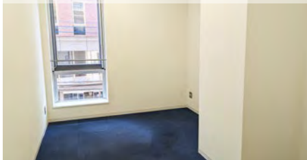
メイン創業支援ルーム B

【面積】約14㎡(4室) 【使用料】13,200円/1ヶ月※ 【入居期間】1年(2回の更新可能)