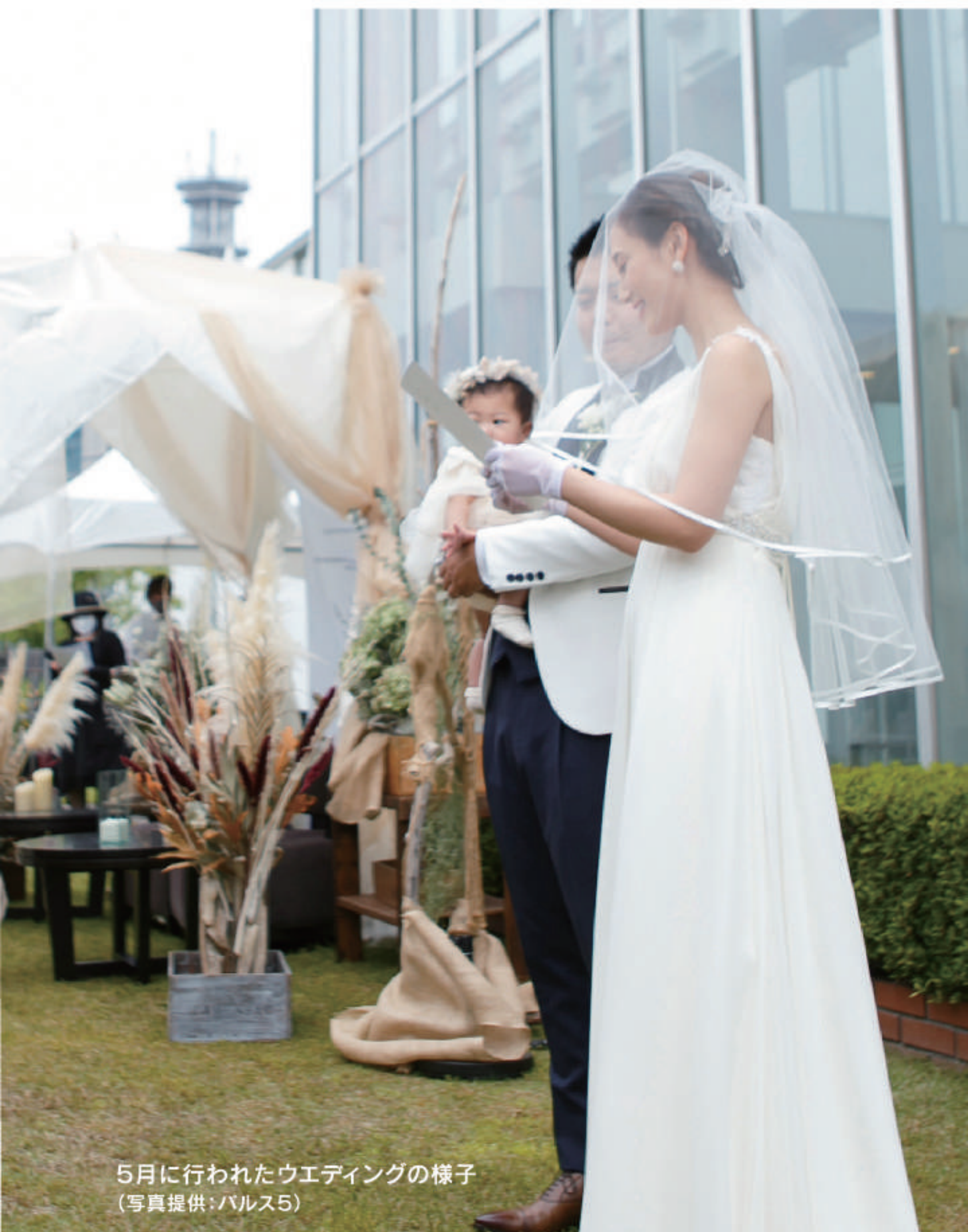
5月に行われたウエディングの様子