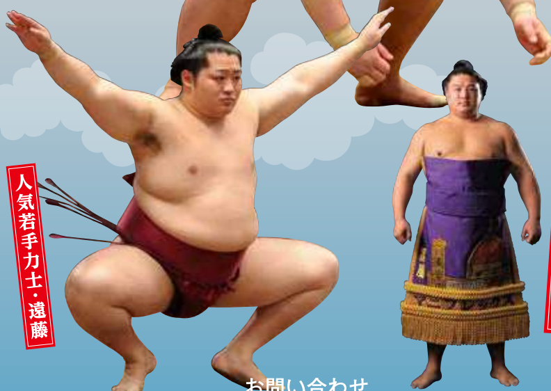
人気若手力士・遠藤