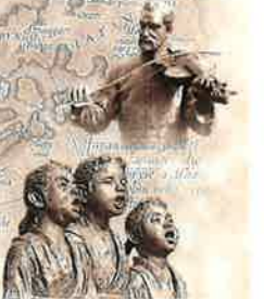
西洋音楽発祥記念像

その一つとして大分県の歴史を紐解き、先人の偉業を顕彰し、また、他分野との連携により広く文化的な環境創出を目指しています。第23回は公益財団法人 文字・活字文化推進機構との共催により「語りと音楽」を企画実施いたします。